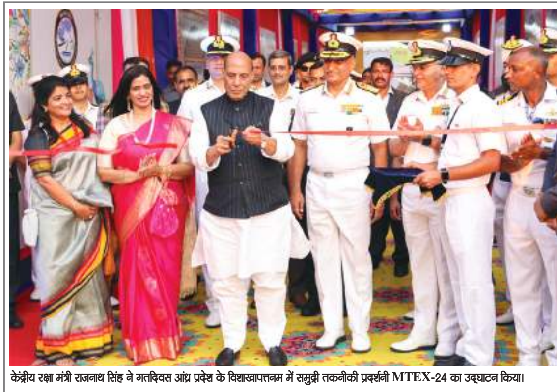
केंद्रीय रक्षा मंत्री राजनवा सिंह ने गतदिवस आंध्र प्रदेश के विशाखापटनम में समुद्री तकनीकी प्रदर्शनी MTEX-24 का उद्घाटन किया।