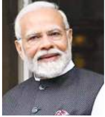
( नरेंद्र मोदी )

प्रधानमंत्री नरेंद्र मोदी ने संत शिरोमणि आचार्य श्री 108 विद्यासागर महाराज जी के बारे में अपने विचार व्यक्त किये हैं। प्रधानमंत्री मोदी ने अपनी वेबसाइट नरेंद्र मोदी डॉट इन पर संत शिरोमणि आचार्य श्री 108 विद्यासागर महाराज जी के संबंध में स्वयं के द्वारा लिखे गए एक लेख का लिंक भी साझा किया है। यहां प्रस्तुत है प्रधानमंत्री मादी द्वारा लिखा गया लेख।