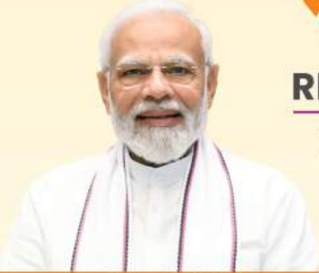
Narendra Modi Prime Minister

REGIONAL INDUSTRY CONCLAVE 1-2 March, 2024 - Ujjain