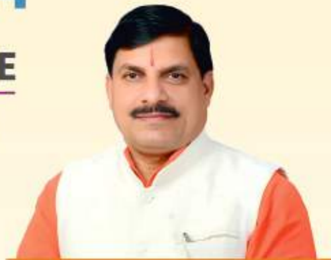
Dr. Mohan Yadav Chief Minister